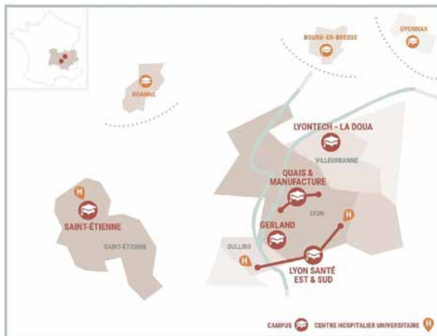
Les campus de l'Université Cible.

« L'objectif du projet IDEXLION est la construction d'une université intensive de recherche à forte visibilité inter-