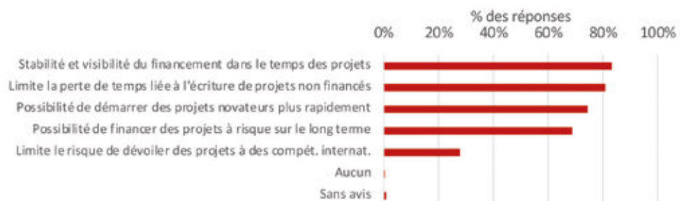
Figure tirée des synthèses brutes des quatre enquêtes menées par un collectif de vingt-trois sociétés savantes sur la loi de programmation pluriannuelle de la recherche – maintenant en ligne. ( https://societes-savantes.fr/sondages/ ).