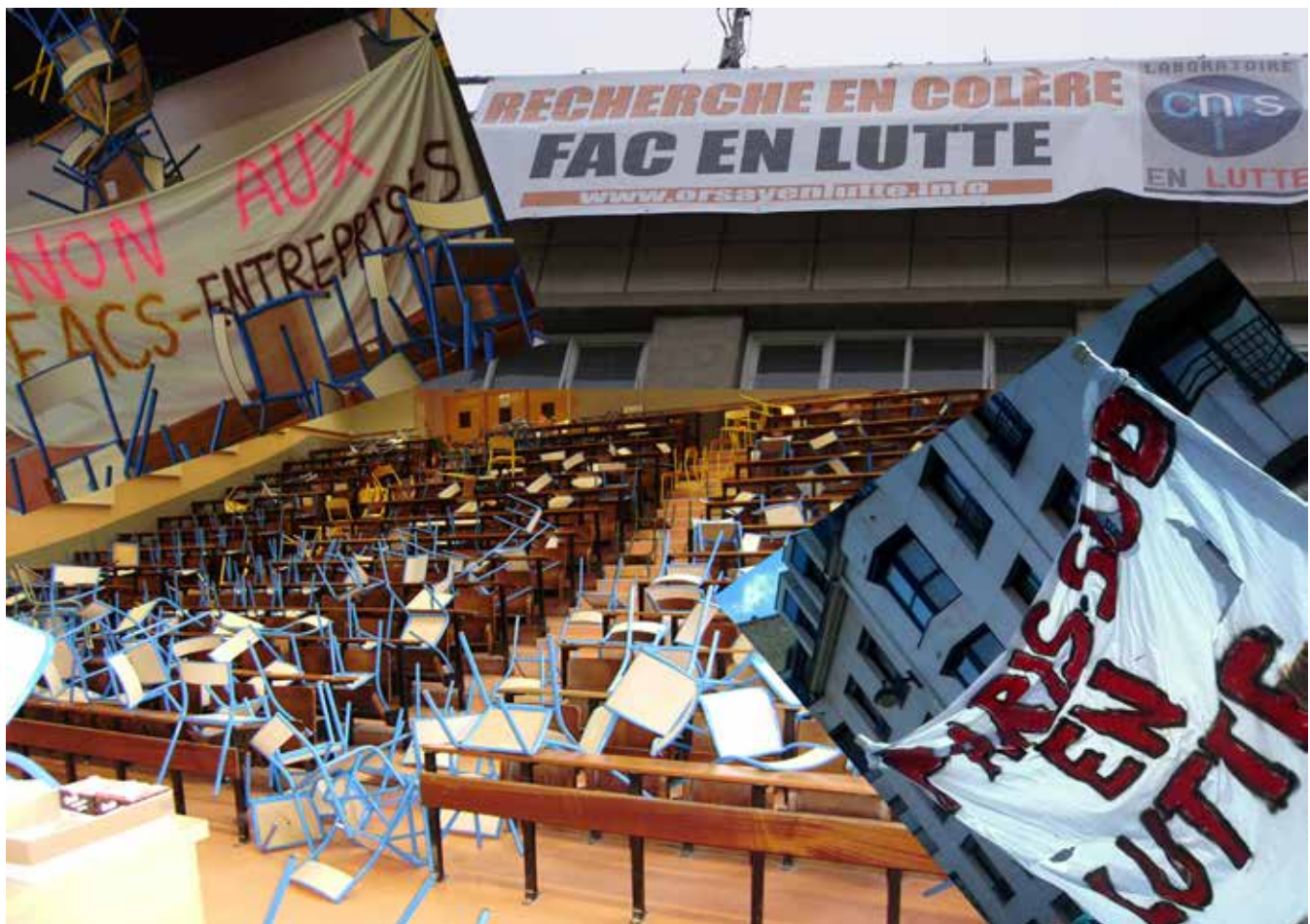
Orsay en lutte.

enjeux de la recherche, sans jamais être écoutés.