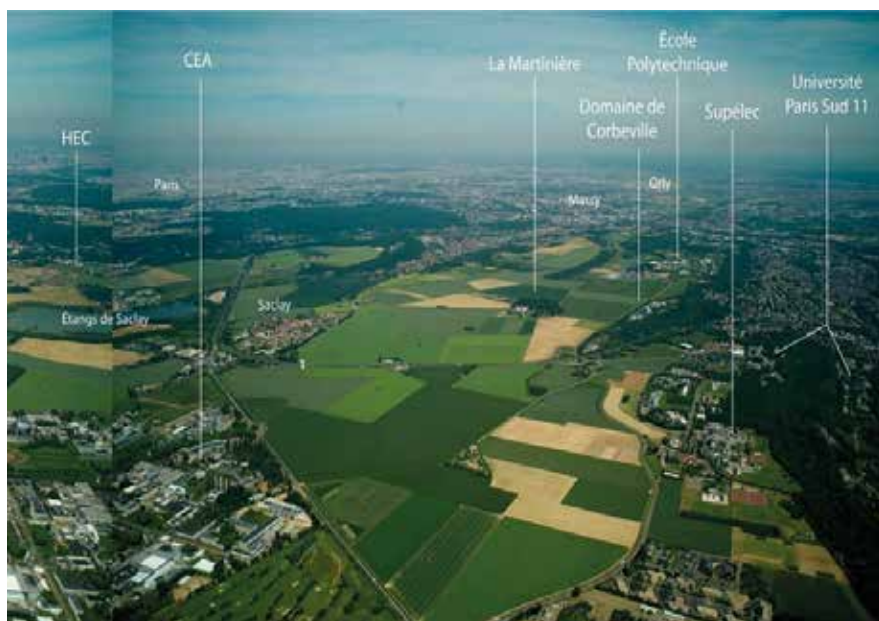
Le Plateau de Saclay : la route départementale 128, à Gif-sur-Yvette, avant les travaux.

autour d'elles... C'est qu'il ne s'agissait pas d'adapter, mais d'imposer et, par un urbanisme auquel, ostensiblement, rien ne doit résister, de manifester à quel point la forme est faite pour tout plier à la volonté du planificateur. Ainsi s'explique qu'on ait préféré organiser le déménagement des tritons crêtés (et tant pis s'ils en meurent) plutôt que leur laisser leur modeste mare ; ce n'est pas simple négligence écologique, c'est, au contraire, très volontaire. Car il eût été ridicule, donc désastreux pour l'autorité, de devoir reculer devant quelques bestioles et de le laisser voir ! La présence d'une vieille mare dans une ville nouvelle aurait risqué de lui donner, de façon incontrôlée, un aspect bêtement humain.