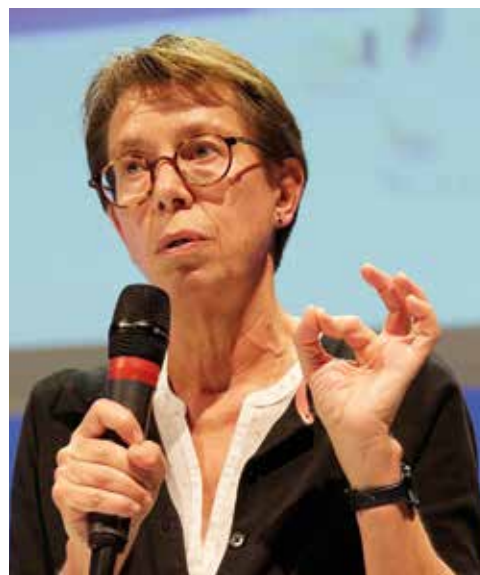
Catherine Jessus, directrice de l'INSB de 2013 à 2019.

2018 a vu les moyens de l'INSB augmentés, grâce notamment à une enveloppe exceptionnelle affectée par le Ministère. Cette petite manne est renouvelée en 2019. Comme en 2018, l'INSB a fait le choix de maintenir la dotation globale aux laboratoires et d'utiliser le surplus pour financer des opérations exceptionnelles, choisies parmi toutes celles que vous nous signalez. En évitant le « saupoudrage », nous espérons ainsi dénouer des points de blocage qui impactaient vos