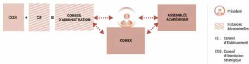
Gouvernance centrale de l'Université Cible.

En termes de gouvernance, il reste impératif que tant de chefs s'accordent sur un super président... Ainsi, la gouvernance sera assurée par un conseil d'établissement constitué du Conseil d'orientation stratégique (COS) et du conseil d'établissement (CE, enfin des élus !), le tout rassemblé en un CA, comme indiqué sur le petit schéma ci-dessus. On fait difficilement pire en termes de cadencage bureaucratique. Souplesse et agilité obligent !